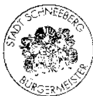
..... Stempel Bürgermeister