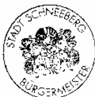
..... Stempel Bürgermeister